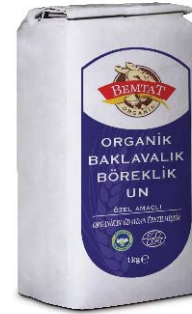
Organik Baklavalık & Böreklik Un

Organik çavdar unu, çavdarın kepek ve rüşeymini de içerir. Dolayısıyla son derece besleyici bir unudur.