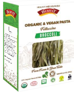
Organik & Vegan Brokolili Fettuccine Makarna