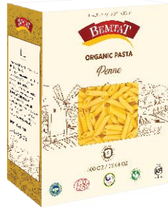
Organik Penne Makarna