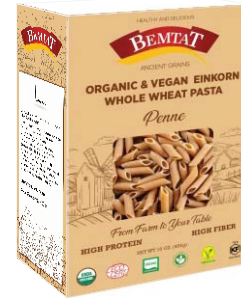
Organik & Vegan Siyez Penne Makarna (Einkorn)