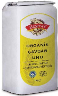
Organik Çavdar Unu

Her türlü pizza yapımında kullanılmak üzere özel olarak üretilmiştir. Yüksek protein değerine sahiptir.