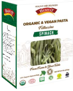
Organik & Vegan Ispanaklı Fettuccine Makarna