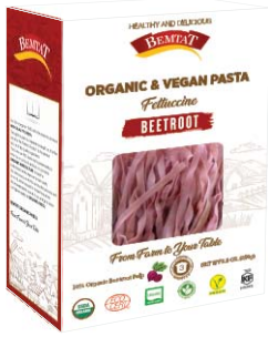
Organik & Vegan Pancarlı Fettuccine Makarna