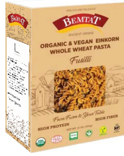
Organik & Vegan Siyez Burgu Makarna (Einkorn)