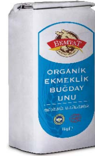
Organik Ekmeklik Un

Ekmek, kek, poğaçaya ve muffin yapımı için ideal bir unudur.