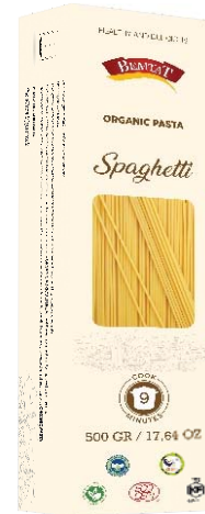
Organik Spagetti Makarna

Siyez / Kavılca Tam Buğday makarnamızı, yaklaşık 12.000 yıl önce Anadolu'da yetiştirilen antik Siyez ve Kavılca Buğdayının taş değirmenimizde öğütülmesiyle elde edilen tam buğday unumuza sadece su ekleyerek ürettik.