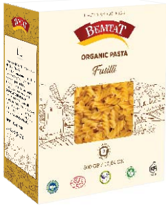
Organik Burgu Makarna