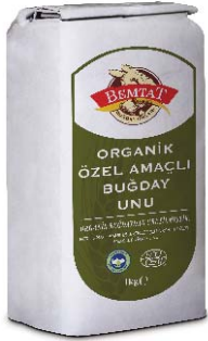
Organik Özel Amaçlı Buğday Unu

Ekmek yapımı için yeterli derecede güçlü, kek ve poğaçaya yapımı için idealdir.