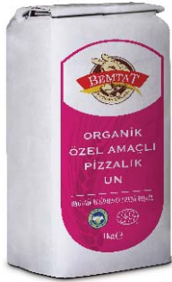
Organik Pizzalık Un

Ekmek yapımında kullanmak için ideal bir unudur. Yüksek protein değerine sahiptir.