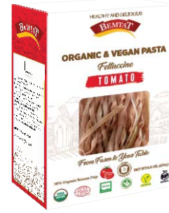
Organik & Vegan Domatesli Fettuccine Makarna