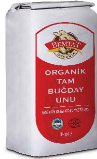
Organik Tam Buğday Unu

Ekmek yapımı için yeterli derecede güçlü, kek ve poğaçaya yapımı için idealdir.